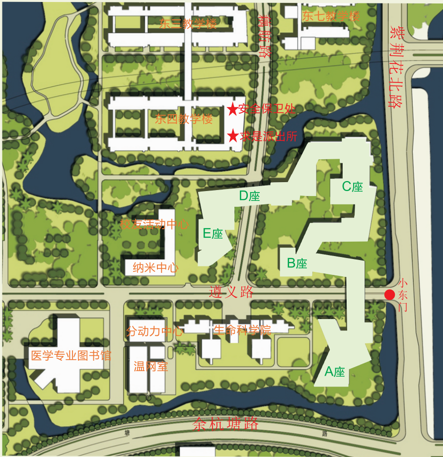
农生环组团平面图