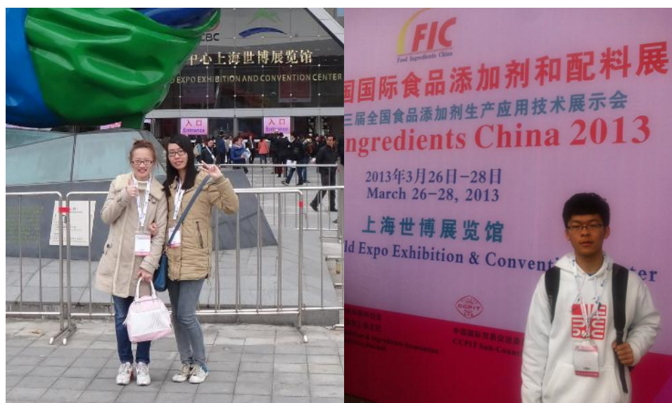
求是科学班（食品安全与营养方向）参加 FIC-2013 展会

第十七届中国国际食品添加剂和配料展览会暨第二十三届全国食品添加剂生产应用技术展示会（FIC-2013）于2013年3月26-28日在上海世博展览馆举行。为了帮助求是科学班（食品安全与营养方向）学生了解食品行业，特别是让同学们对功能性食品添加剂和配料的正确认识 and 了解，2013年3月26日，研究院组织班级参加展览会。