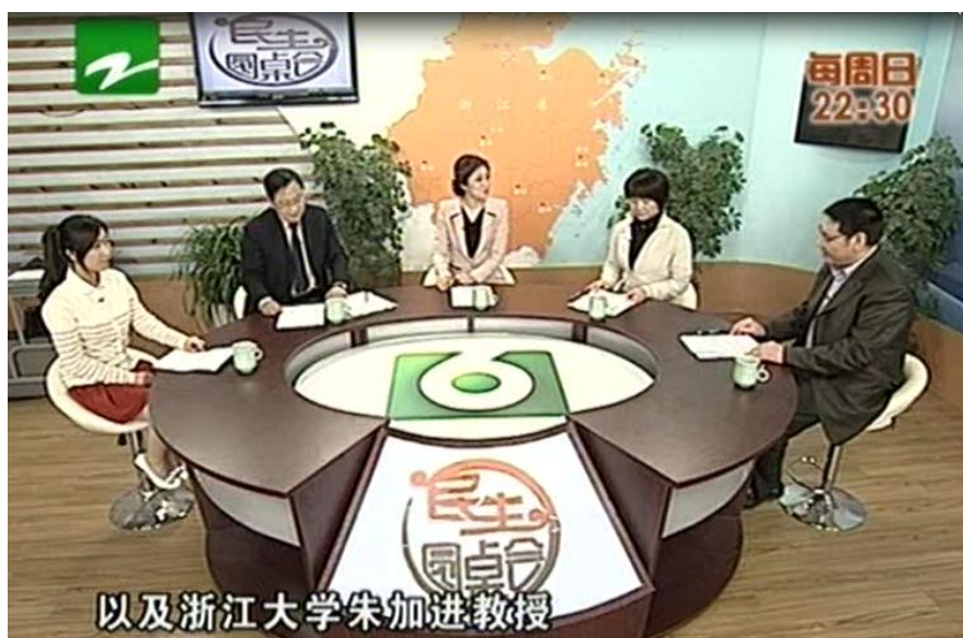
“食品安全与营养”系列节目第一期

为给百姓在食品与健康方面科学的指导，消除在食品营养与安全方面的误解。同时履行研究院的社会义务，更好地服务社会、服务行业，研究院与浙江电视台民生频道“民生圆桌会”节目展开合作，推出“食品安全与营养”系列节目，为老百姓普及食品营养与安全方面的专业知识。