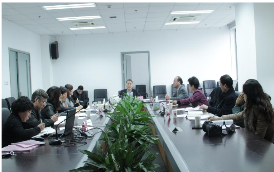
浙江大学教育基金会馥莉食品研究院基金理事会审议相关文件

继续推进学生的国际交流，进一步拓展与不同国家和地区著名高校的合作，完善学生国际交流机制。会议建议通过开展义工活动、参加国家机构实习等多种形式，丰富求是科学班（食品营养与安全方向）学生的社会实践等。