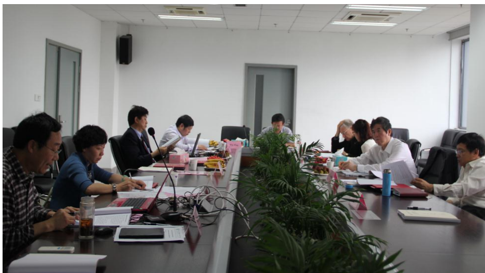
浙江大学馥莉食品研究院第一届学术委员会审议相关文件

学术委员会会议由孙宝国院士主持，会议审议并原则通过了《浙江大学馥莉食品研究院学术委员会工作章程（草案）》、《浙江大学馥莉食品研究院基金资助科研项目管理辦法（草案）》，通过了《浙江大学馥莉食品研究院课程建设项目管理办法（草案）》及课程规划、《浙江大学馥莉食品研究院实验室建设项目管理办法（草案）》及实验室建设规划。